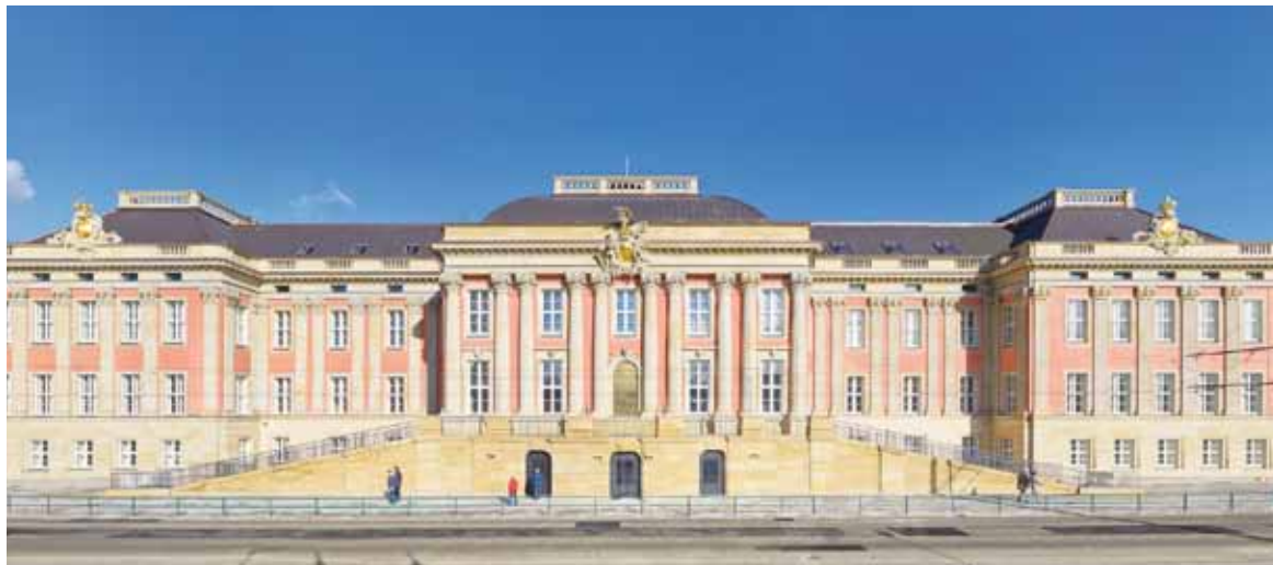
Traditionsbewusst und modern - die CDU-Fraktion freut sich auf das neue Parlamentsgebäude im Herzen Potsdams.

Nicht zuletzt durch das Engagement vieler Bürger und die großzügigen Spenden entstand ein Bau, der das Stadtbild Potsdams bereichert und