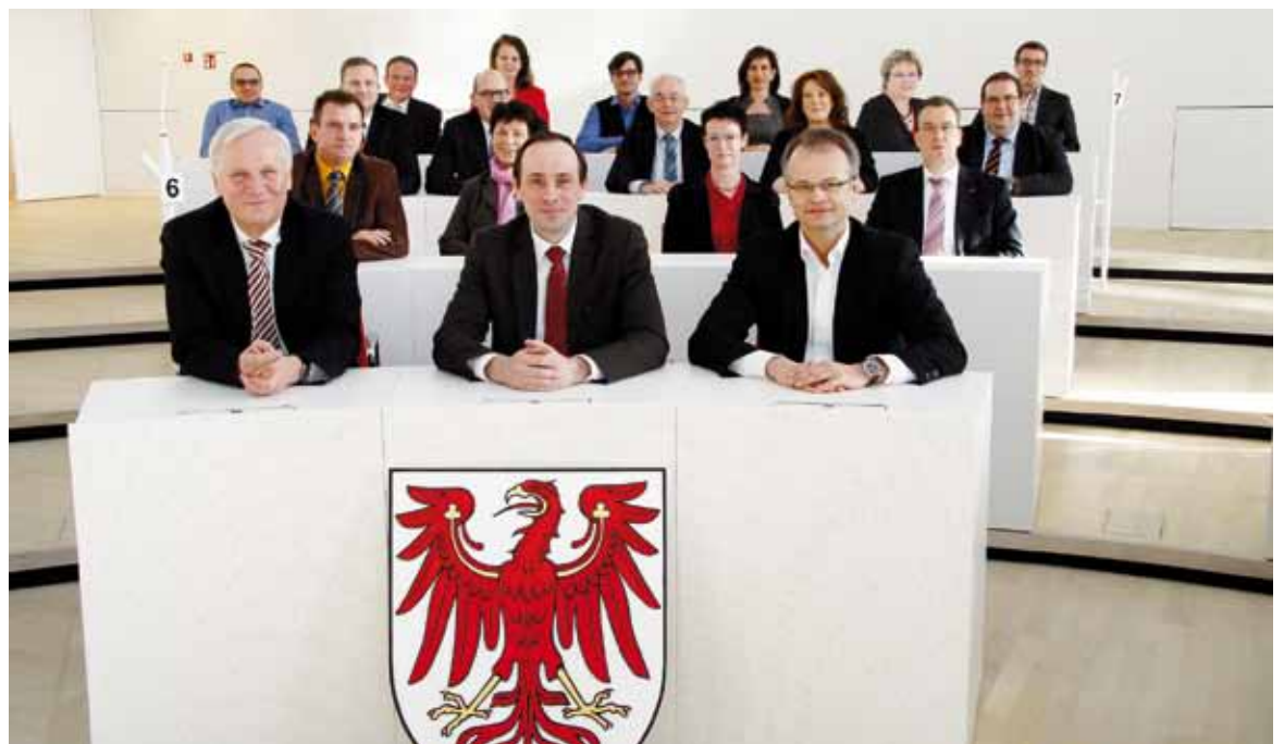
Die 19 Abgeordneten der CDU-Fraktion im neuen Plenarsaal

Wenn Sie Interesse an einem individuell geführten Landtagsbesuch und der Arbeit der CDU-Fraktion haben, können je nach Gruppe, Altersklasse und Anliegen Termine vereinbart werden. Für die Organisation wenden Sie sich bitte an unser Bürgerbüro. Unsere Mitarbeiter stehen Ihnen gern per Telefon unter 0331/9661423 oder per E-Mail an dialog@cdu-fraktion.brandenburg.de zur Verfügung.